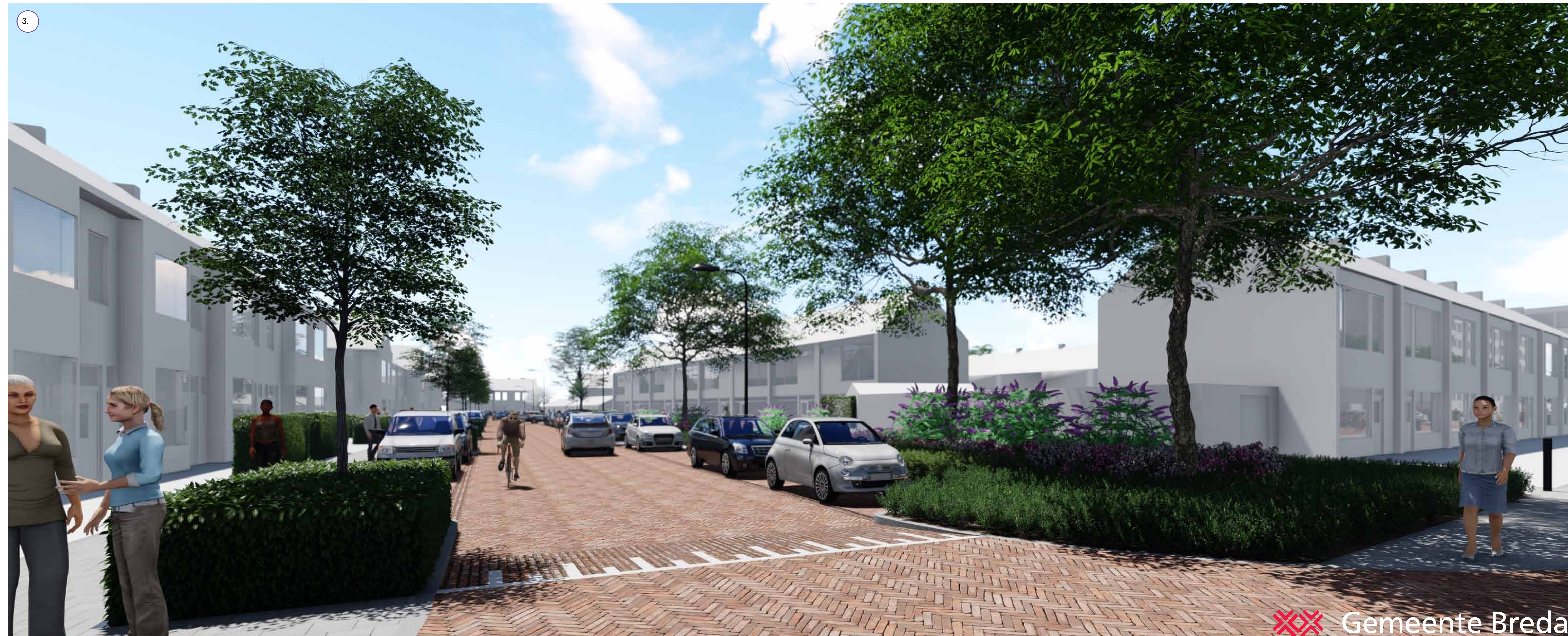
Dichte beplanting om hondenpoep tegen te gaan. De beplanting en de nieuwe bomen zorgen voor een groene uitstraling, reduceren van warmte en de opvang van regenwater.