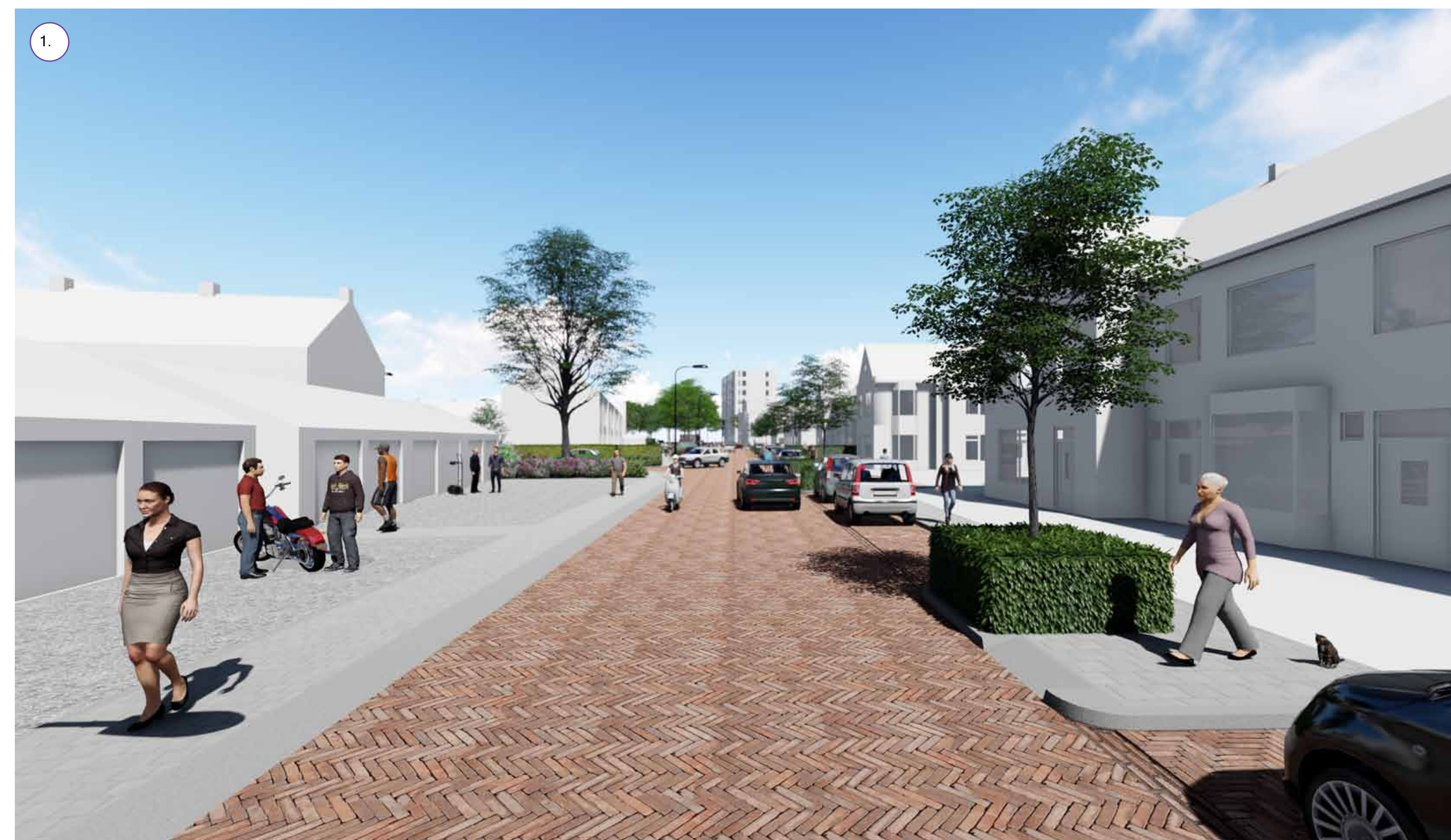
Kleine bomen in een haag tussen de parkeervakken voor een groenere straat.