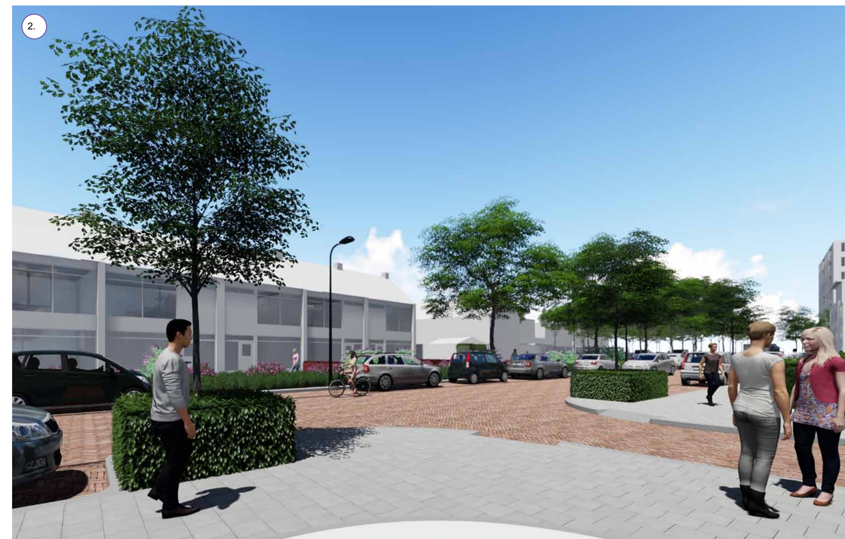
Plantvakken en boomspiegels met heesters en hagen om hondenpoep tegen te gaan.