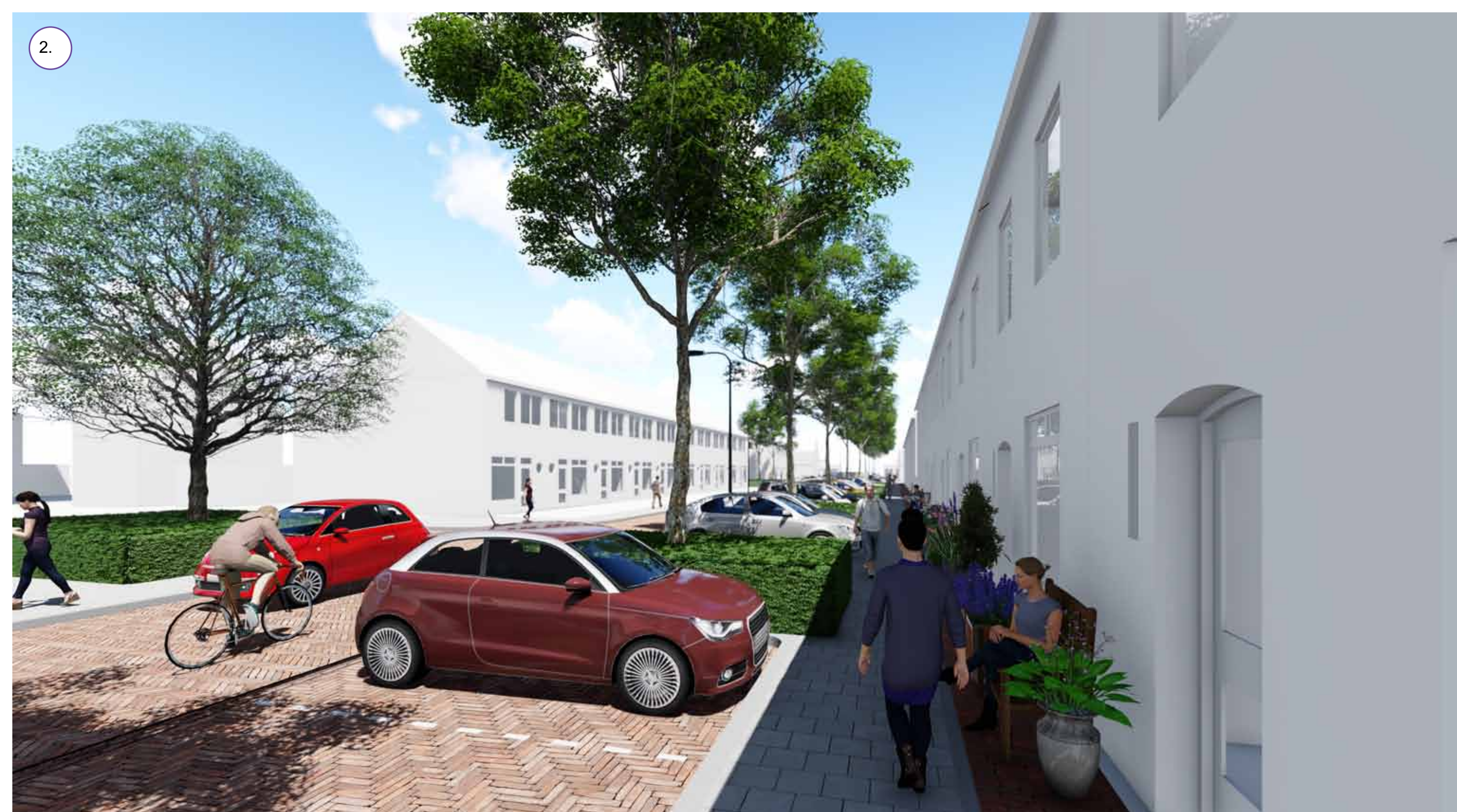
Strook langs de woningen en toevoeging van haagblokken ontmoedigen fietsen over de stoep