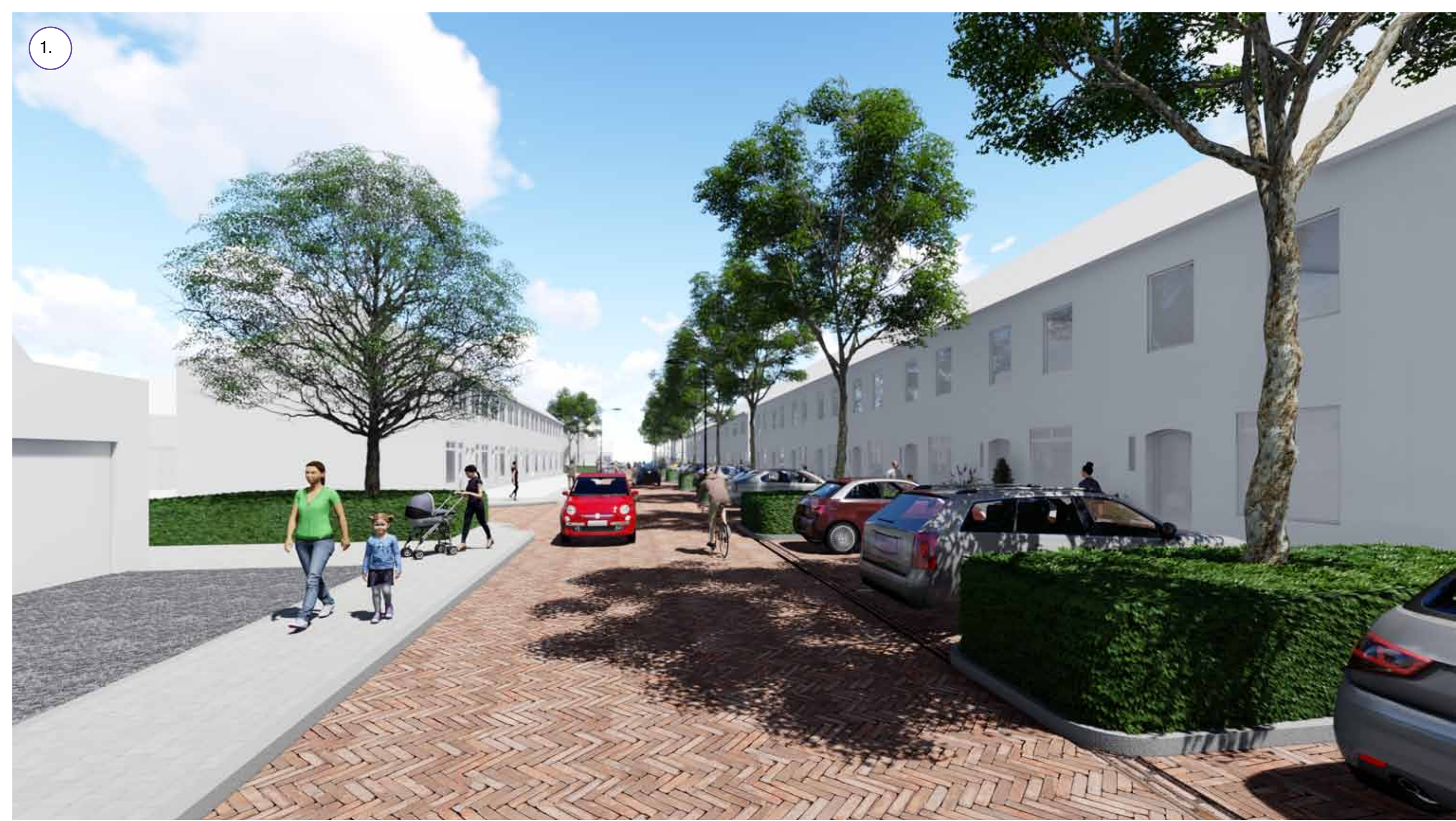
Groenere uitstraling door het toevoegen van bomen en de haagblokken tussen de parkeervakken.