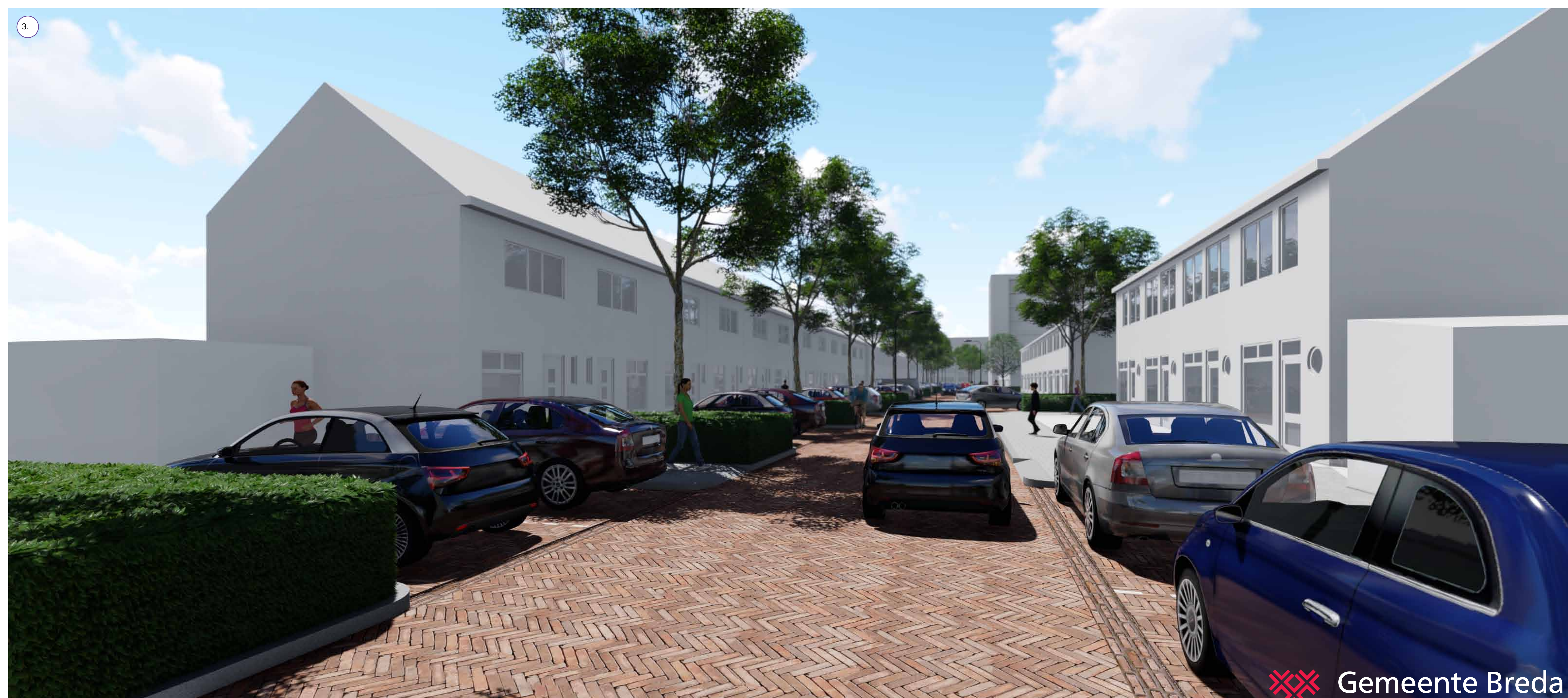
Auto's worden deels aan het zicht onttrokken door de haagblokken. De bomen krijgen meer groeiruimte